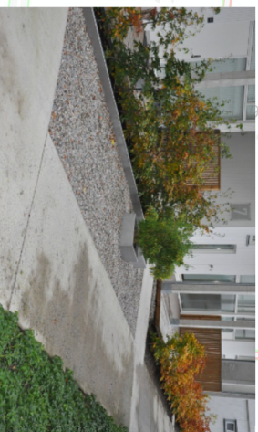
Forslag: Materialbruk: dekke, kanter og faste detaljer