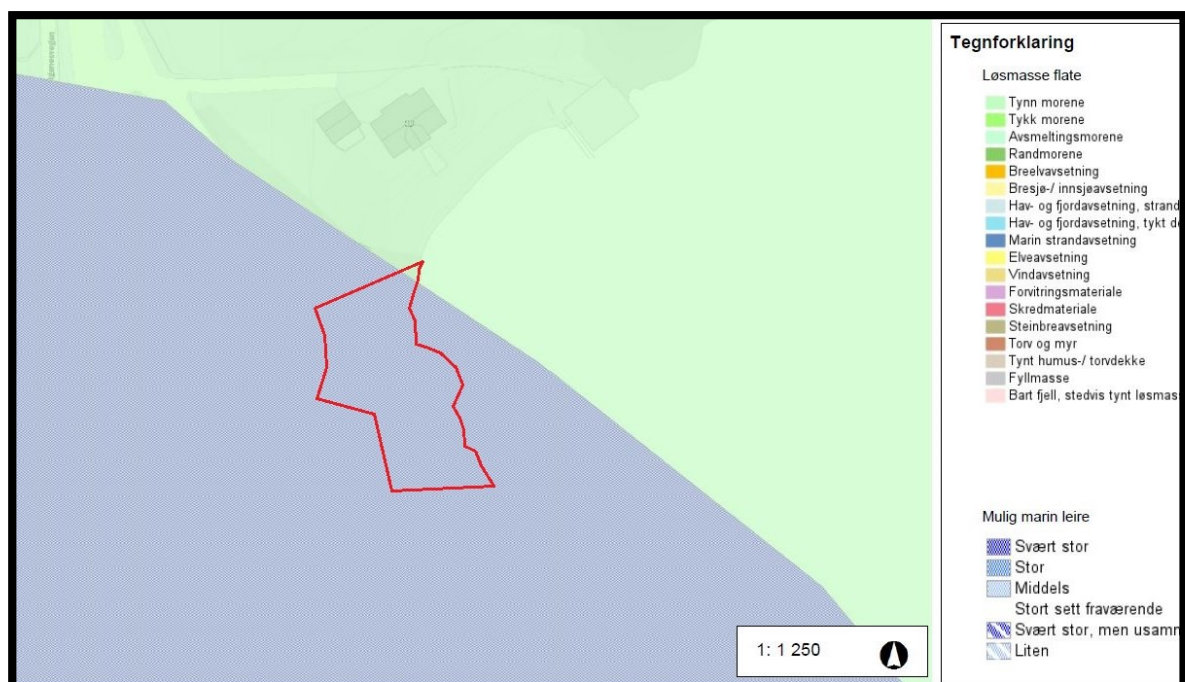
Figur 01 – Marine grense sone i blått.

Nord vestlige del av planområdet befinner seg i et bratt landskap og dette kombinert med at planområdet ligger i et område på Karmøy som er registrert under marinegrensen, noe som kan forårsake utfordring under byggeprosessen.