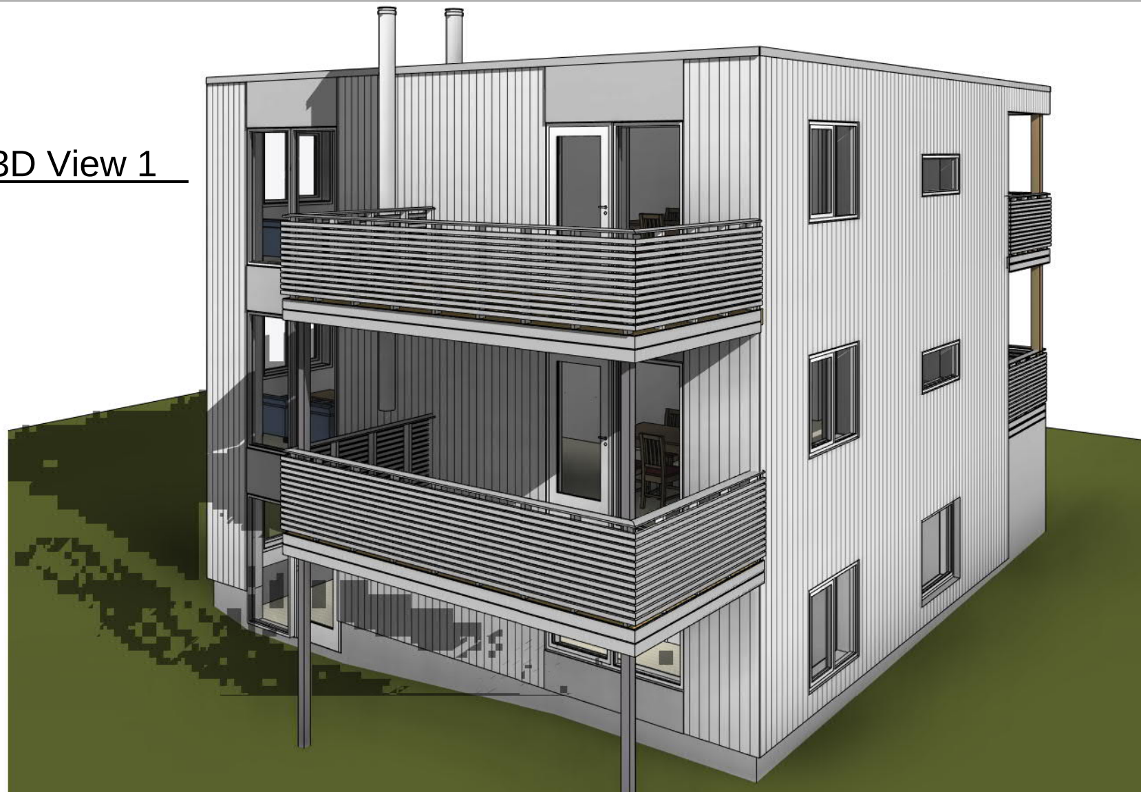
3D View 1