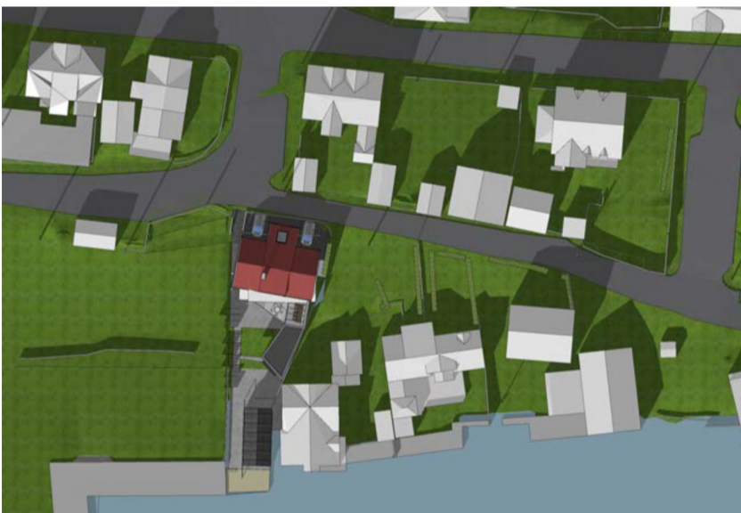
23.03 kl 15