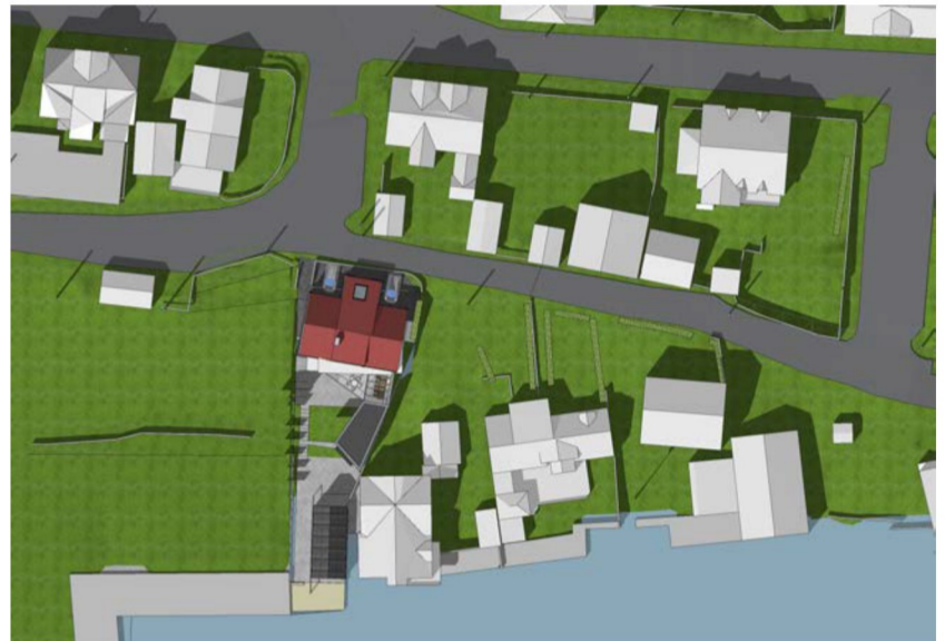
23.06 kl 15