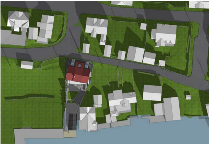
23.03 kl 12