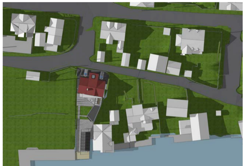
23.06 kl 18