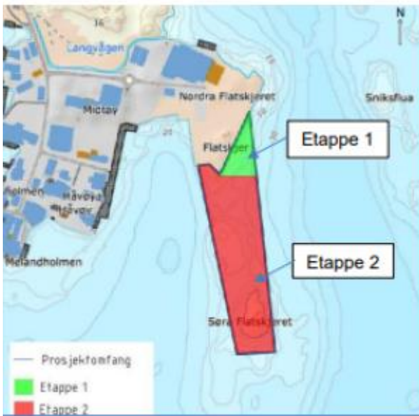
Figur 1. Etappe 1 og 2 illustrert i tiltaksområdet.