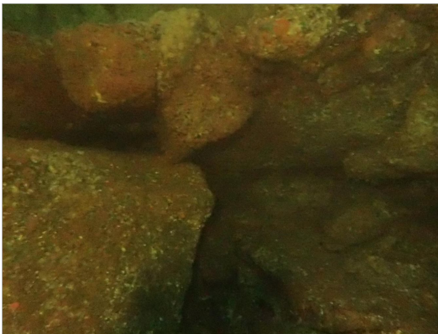
Bilde 8: Bildet er tatt inn i åpningen under bakmur ved akse 10.

Siden det er liten berøringsflate og store steiner (Blokkstein) som er klassifiserte som rene steiner, så mener vi det ikke trenger å utføres ytterligere miljøtiltak.