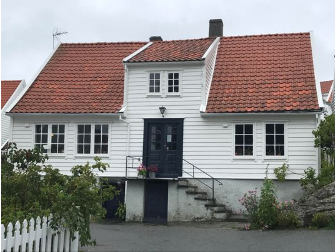
Bilde 8: Eksisterende situasjon, sett fra Søragedå