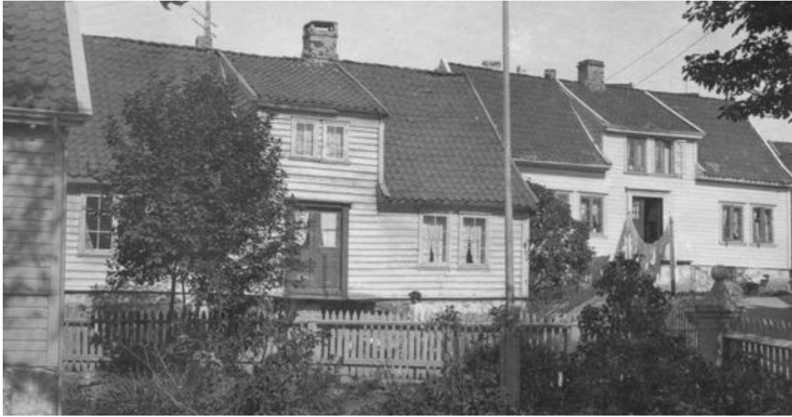
Bilde2: Det har tidligere vært brukt skiferheller på pipene.