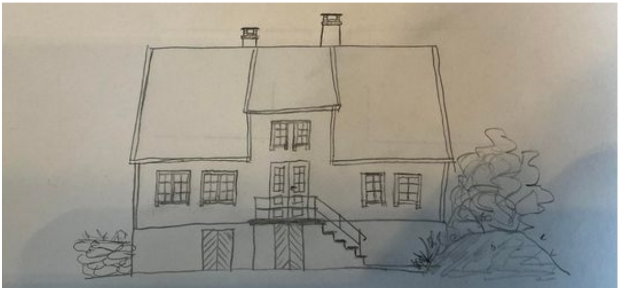
Bilde 6: Piper med skiferheller.