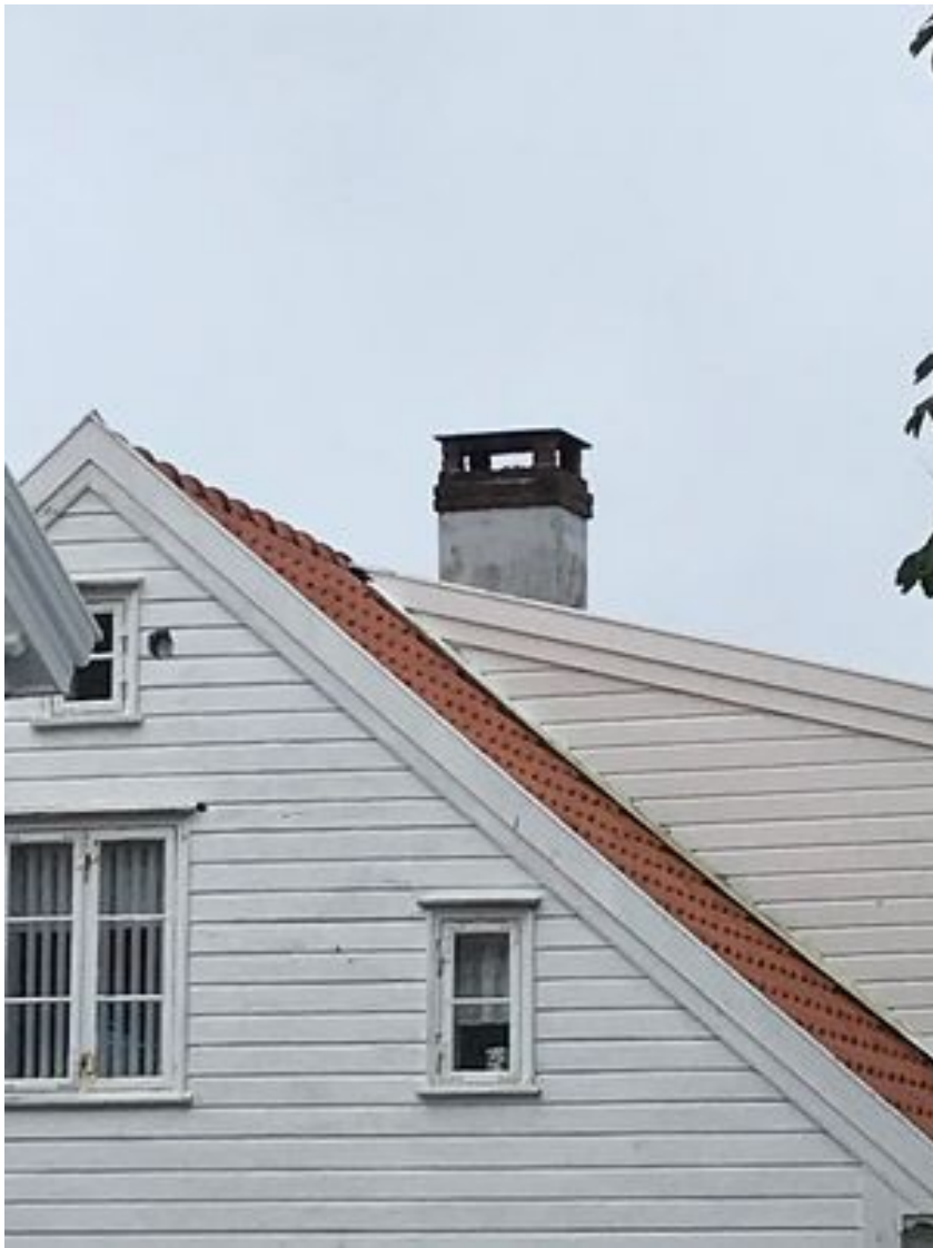
Bilde 3: Eksempel på nabo som har fått satt inn rør i pipen og montert skiferhelle på toppen. Man kan så vidt skimte røret.