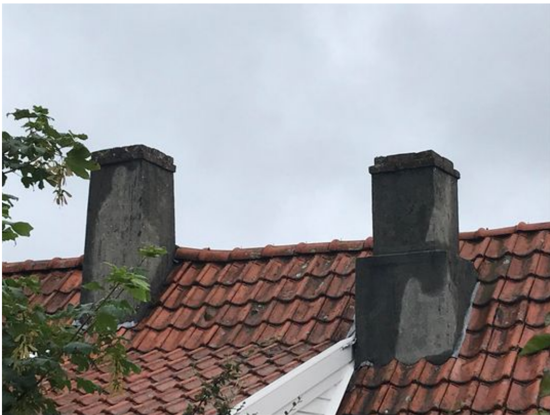
Bilde 9: Eksisterende situasjon, sett fra privat bakgård.