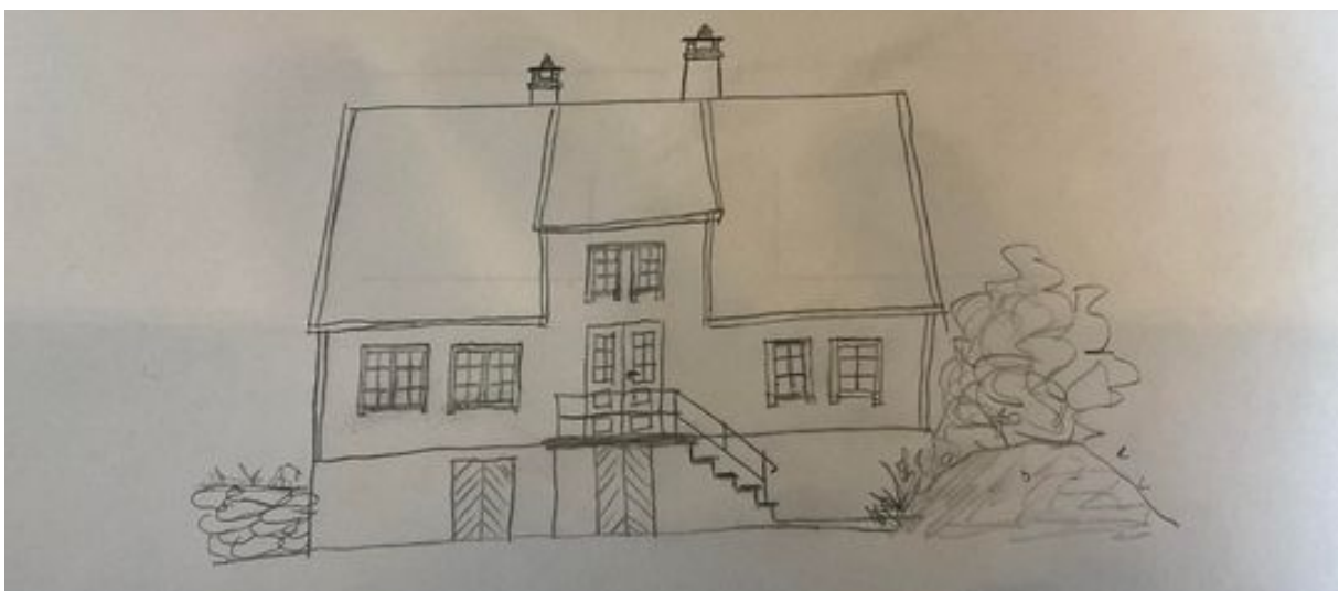
Bilde 7: Piper med skiferheller og stein – ønsket utforming.