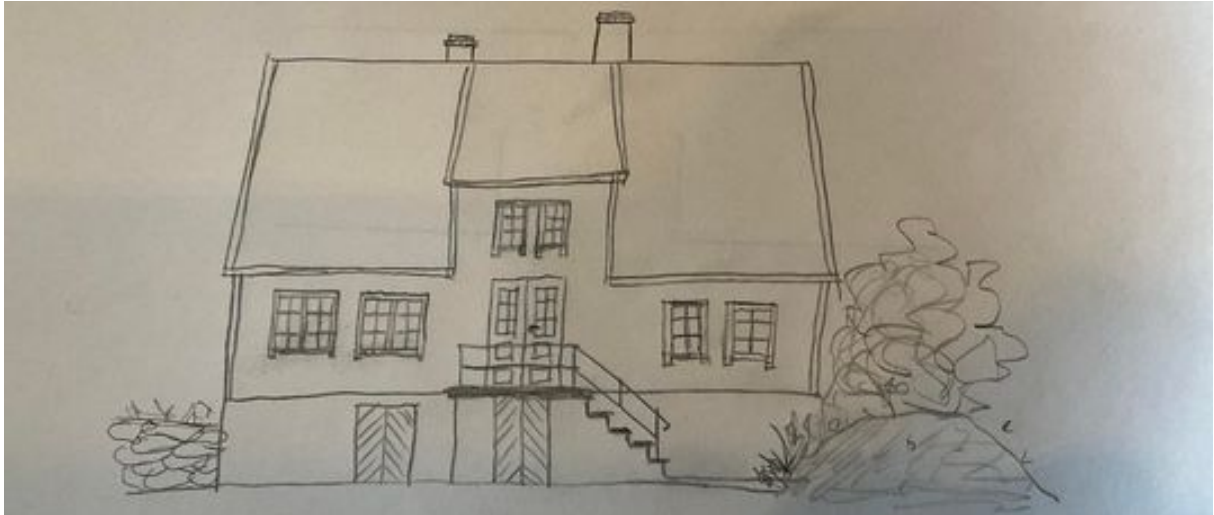
Bilde 5: Dagens utforming