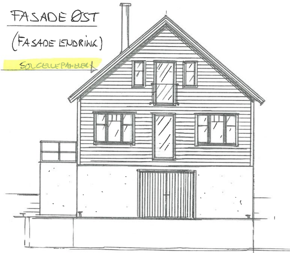
FASADE ØST (FASADE LENDRING)