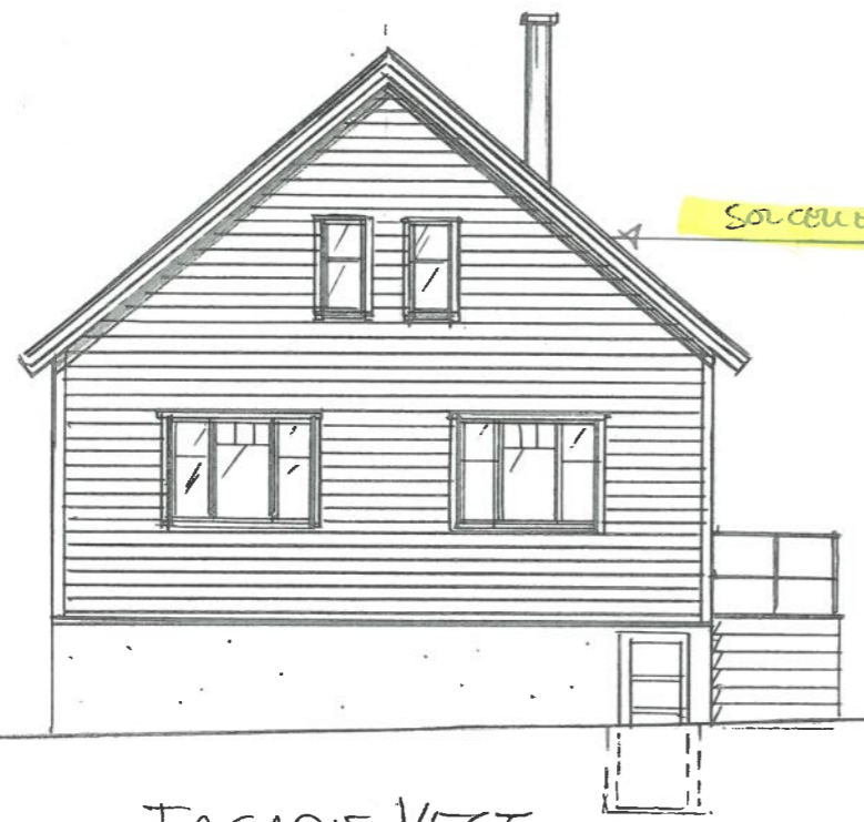
FASADE VEST (SOM FØR)