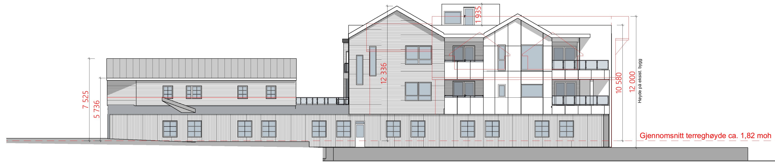
1:200 Fasade Vest