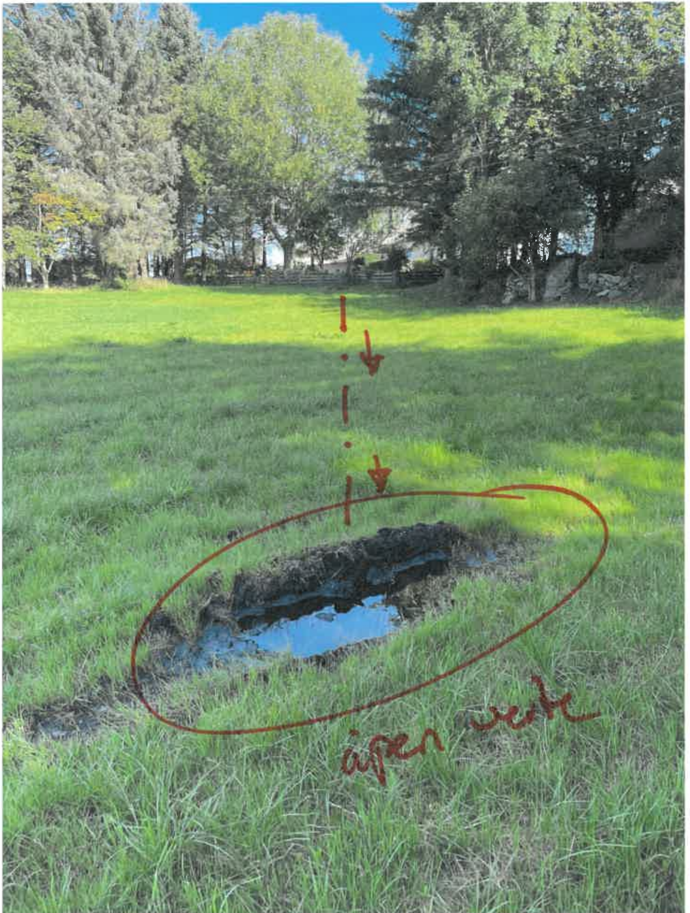
Åpen verte fra arkopsarbeidet