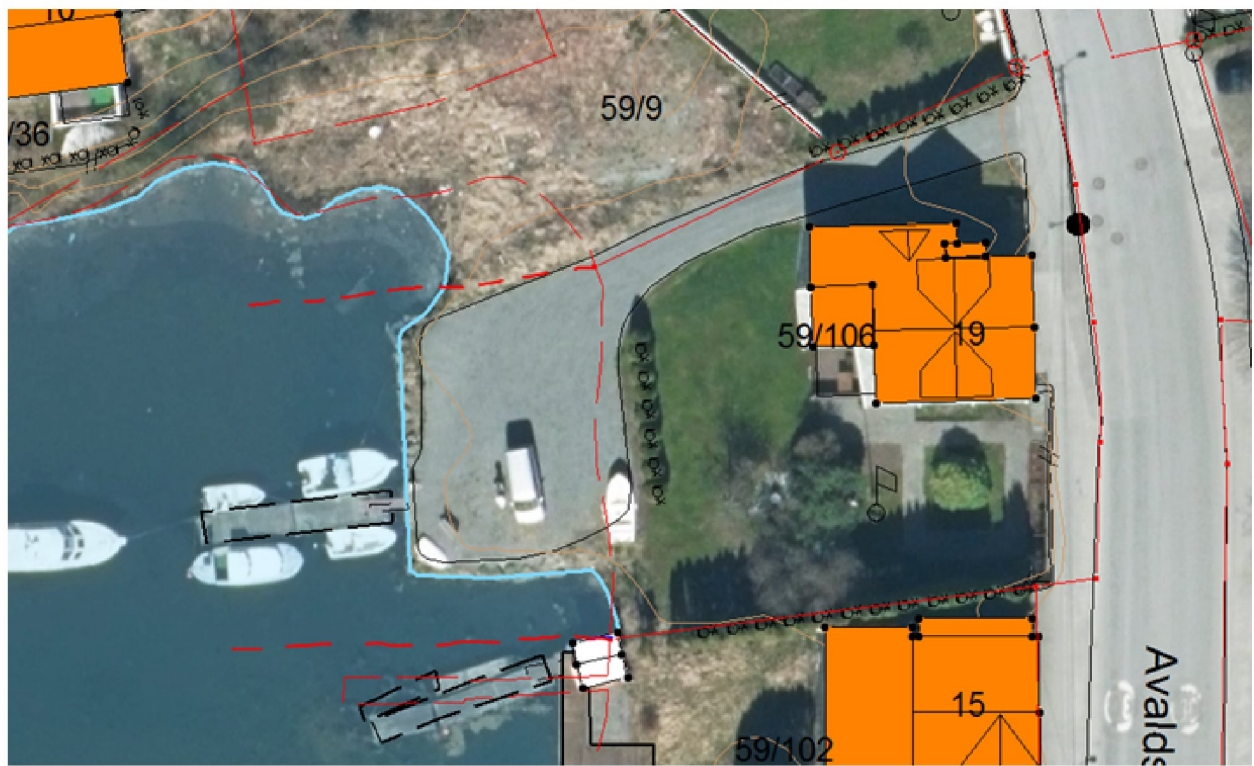
(90'grader på sjøkanten)