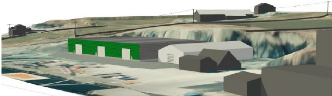
Illustrasjon-rubbhallen i lysegrått