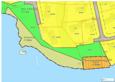
Fig.1: Reguleringsformål: Fortøyning Utsnitt fra planbestemmelser 319 ØSTREM 16.12.77

I plankartet (datert 09.04.18) som ble lagt ut til offentlig ettersyn var området til tomten 66/239 uendret, men i plankartet (datert 29.10.18) som ble lagt ut til offentlig ettersyn er området endret til offentlig friområde. I kommunedelplanen som da ble gjeldende fra 13.05.2019 fikk gjeldende tomt 66/239 endret arealbruk fra annet spesialområde (fortøyning) til offentlig friområde. I forbindelse med denne endringen kan vi ikke se at det er utført ROS-analyse eller konsekvensutredning i dette området. Siste ROS-analyse og konsekvensutredning som ble gjennomført av Kamrøy Kommune er datert 29.10.2018 og tar ikke for seg område som ble omgjort.