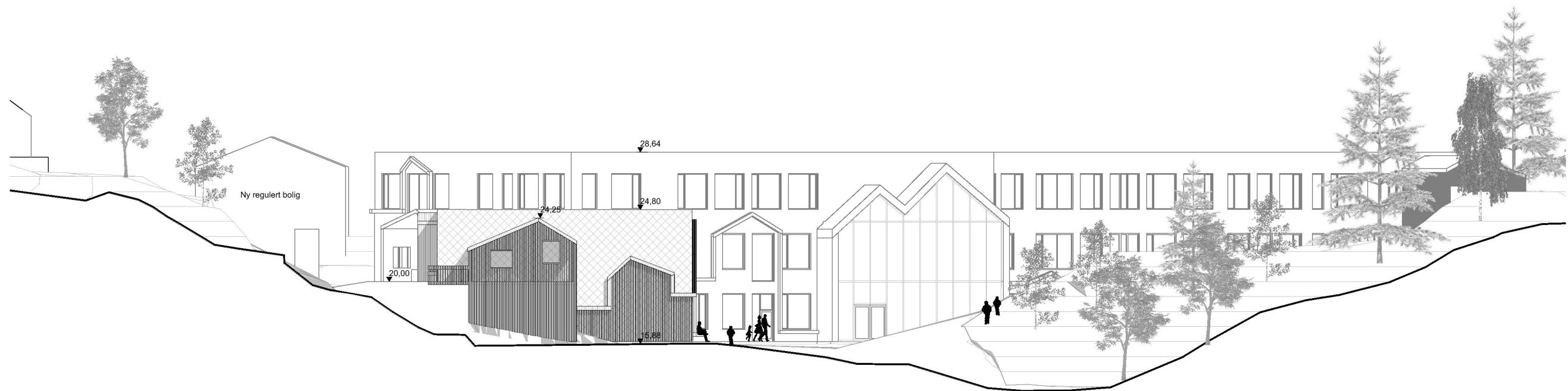
Fasade hall vest