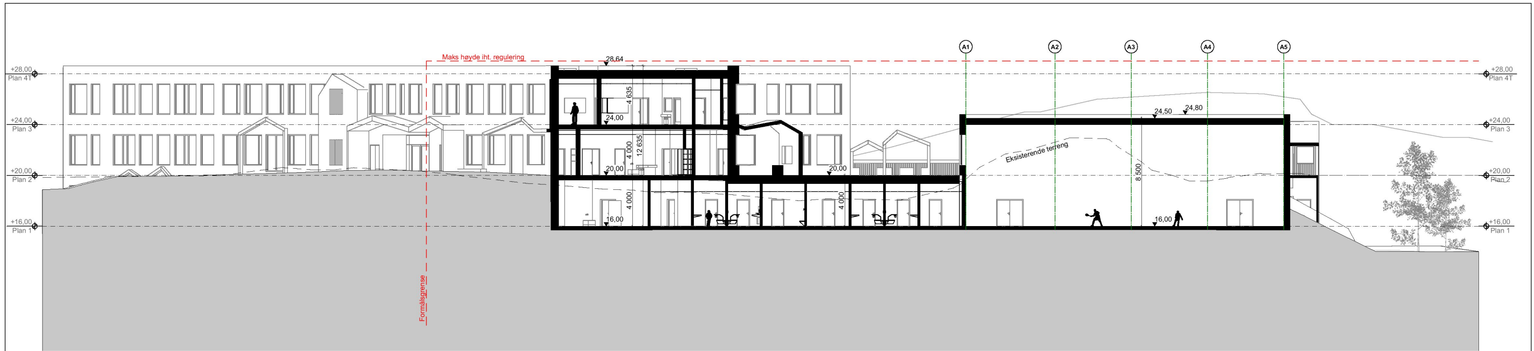
Langsnitt hall C-C