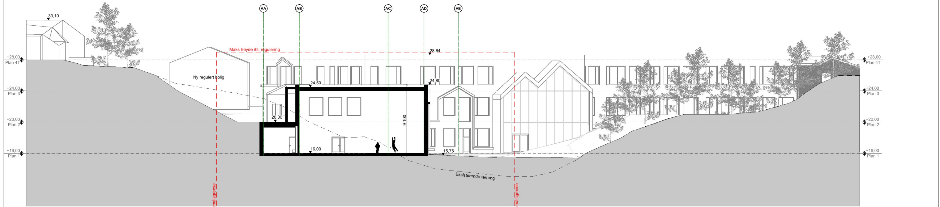
Tverrsnitt hall D-D