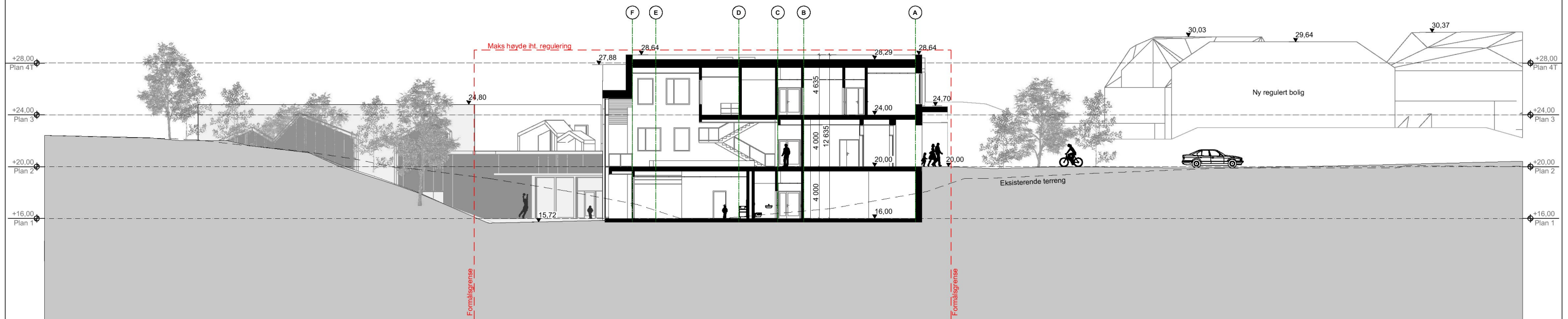
Tverrsnitt skole B-B