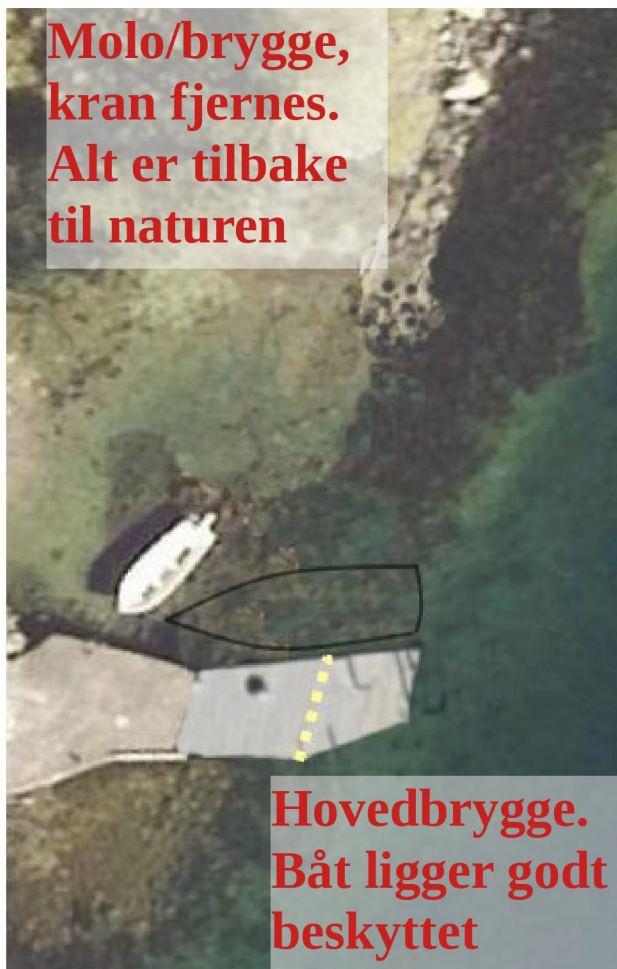
Figur 2 a: Avslått søknad.

Båt (tegnet svart) ligger trygt her. Vi ser at samlet bryggeanlegg er vesentlig mindre omfattende enn før tillatelse ble gitt.