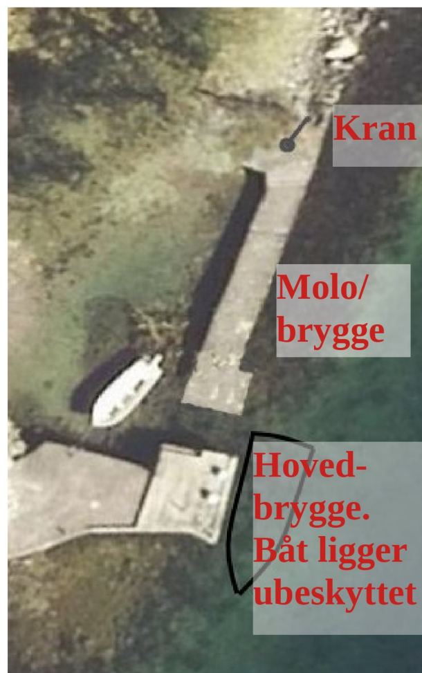
Figur 2 b: Situasjon før 2017.

Båt (tegnet svart) ligger trygt her. Vi ser at samlet bryggeanlegg er vesentlig mindre omfattende enn før tillatelse ble gitt.