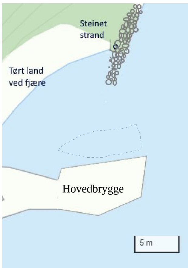
Figur 1 a: Avslått endringssøknad

På tross av alle disse fordelene ble endringssøknaden avslått.