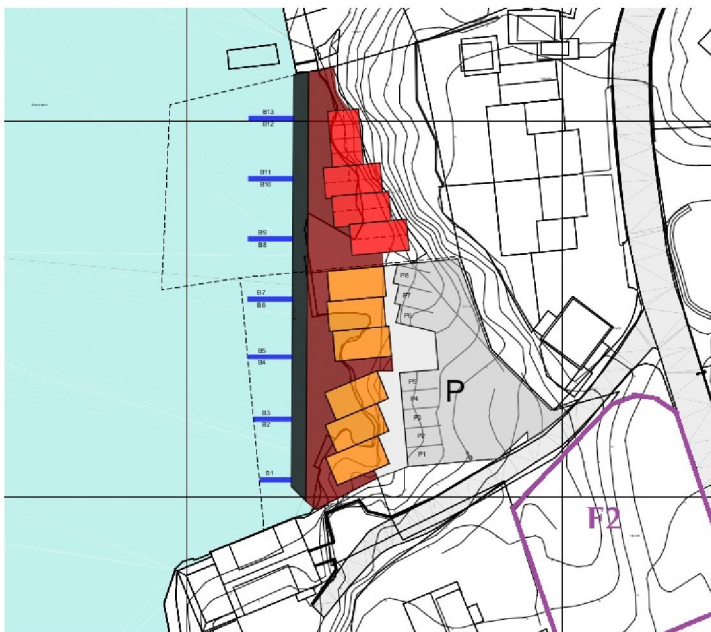
Figur 01 – Biloppstillingsområdet for tilkomst til tursti første steg (oransje bygg) + parkering allerede godkjent.