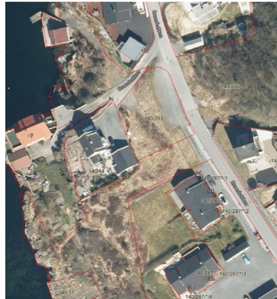
Figur 2 – Tomte grenser over dagens Ortofoto.

Det er ikke varslet om noe hus, vi søker kun om reguleringsendring av formål. Bolig i ettertid må søkes og nabovarsels.