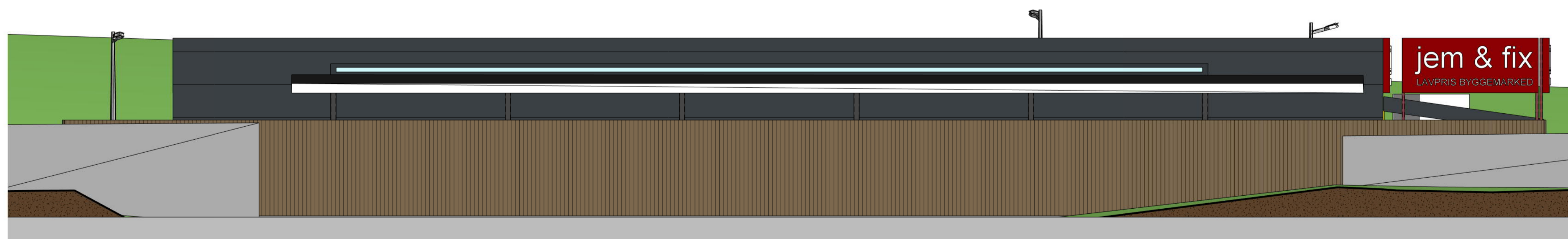
Fasade mot sør 1_100 1 : 100