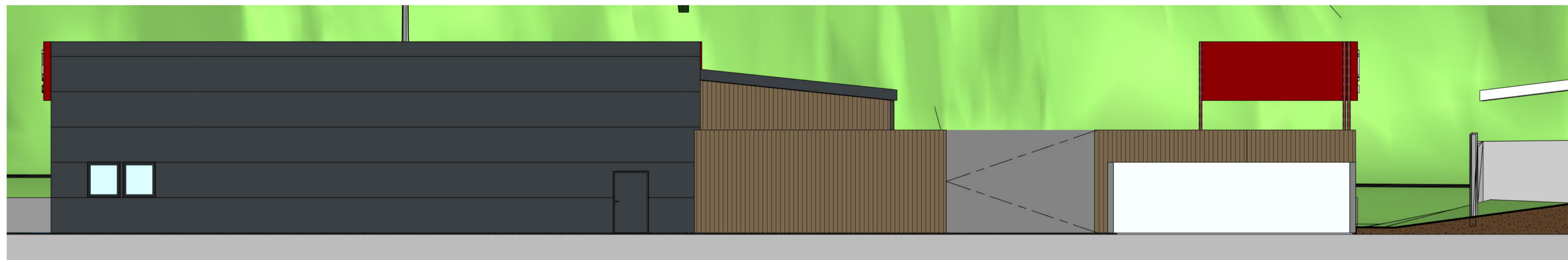
Fasade mot vest 1_100 1 : 100