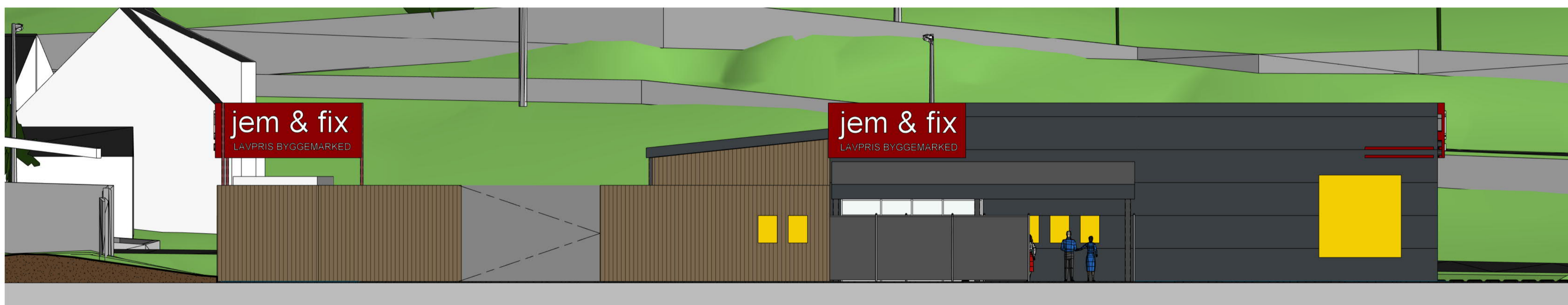
Fasade mot øst 1_100 1 : 100