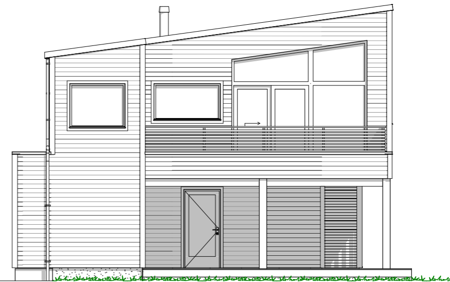
1:100 Fasade Vest