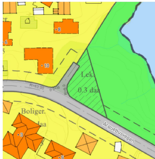
Figur 2 Reguleringsplan 507 Trevarden

Gjeldende reguleringsplan viser kjørevei og boliger, jfr. fig. 2.