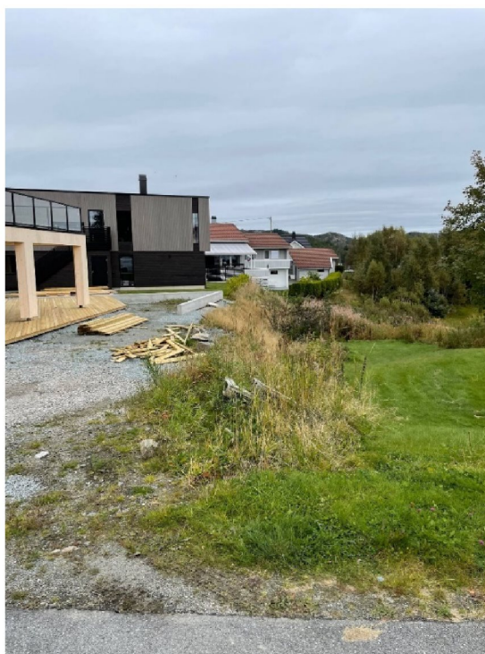
Bilde fra planområdet (tatt mot nord)