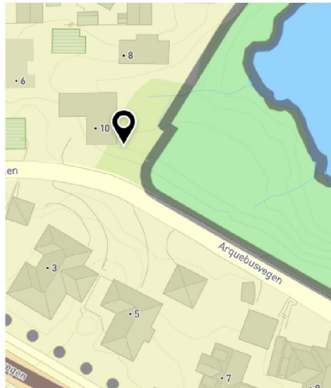
Figur 1 Utsnitt av kommuneplanen