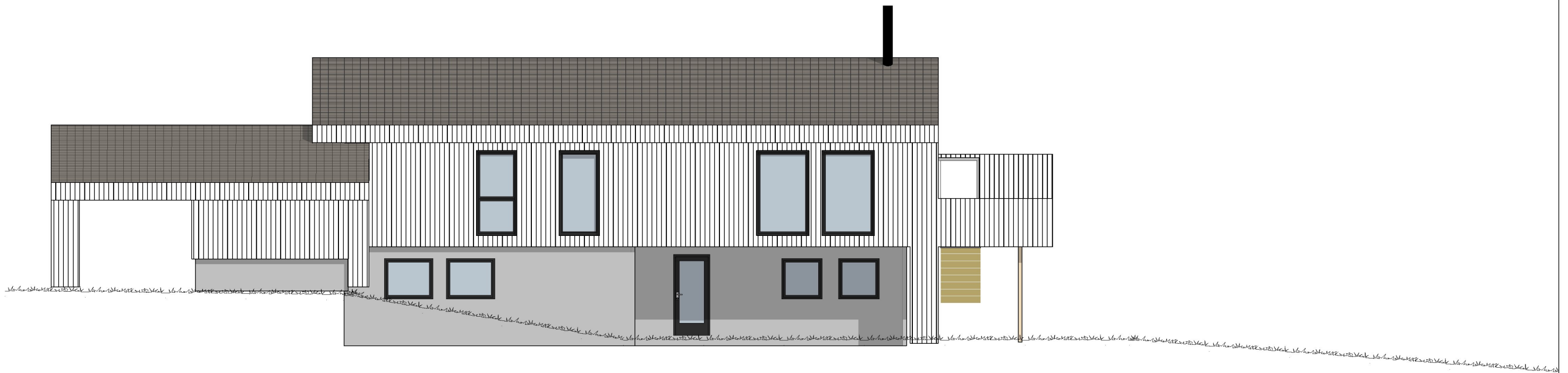
1:100 Fasade Vest