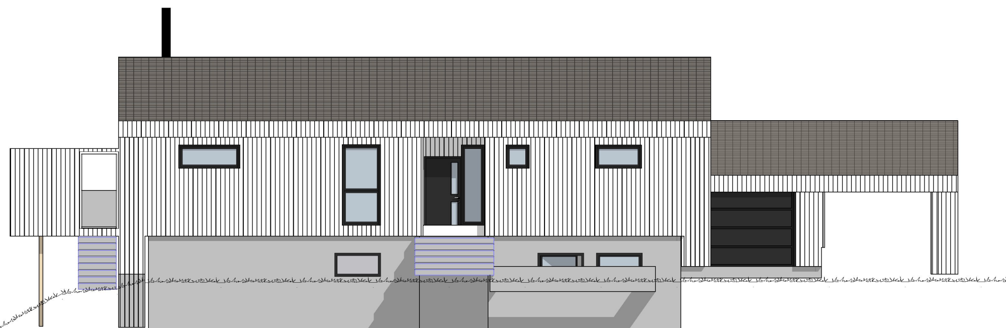
1:100 Fasade Øst