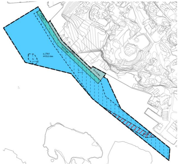
Figur 2 Oversiktskart (venstre) og forslag til plankart (høyre).