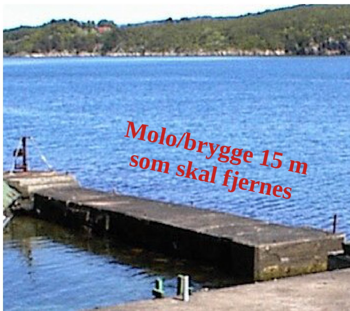
Situasjon før 2017 Molo/brygge 15 m

Flere bilder som viser situasjonen ved sjøen for 118/11 før 2017 og 2022.