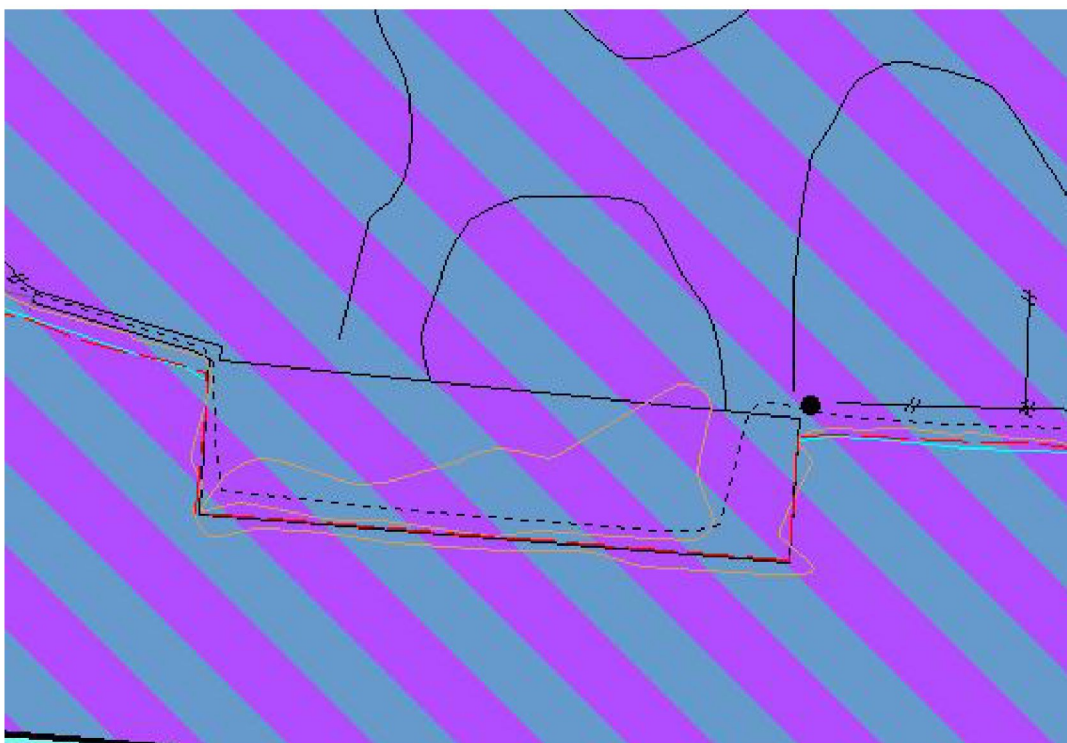
Kaien på reguleringsplankart