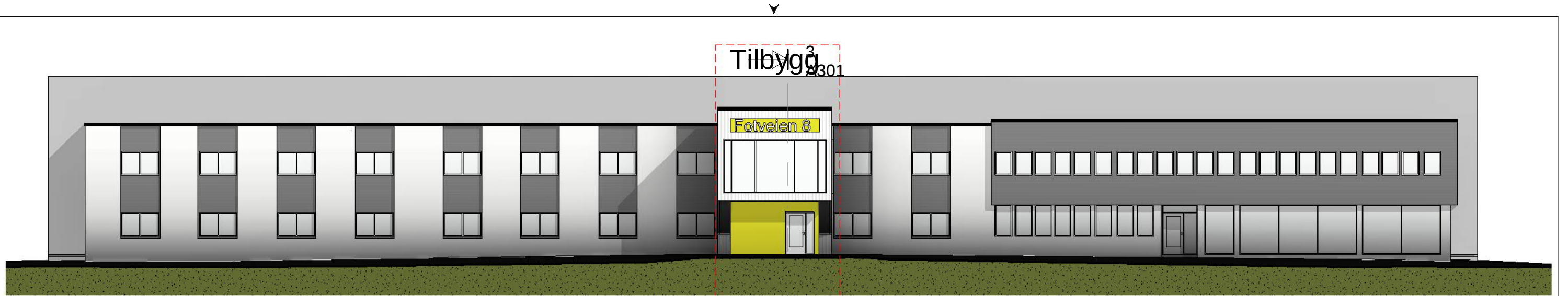
Øst 200 1 : 200