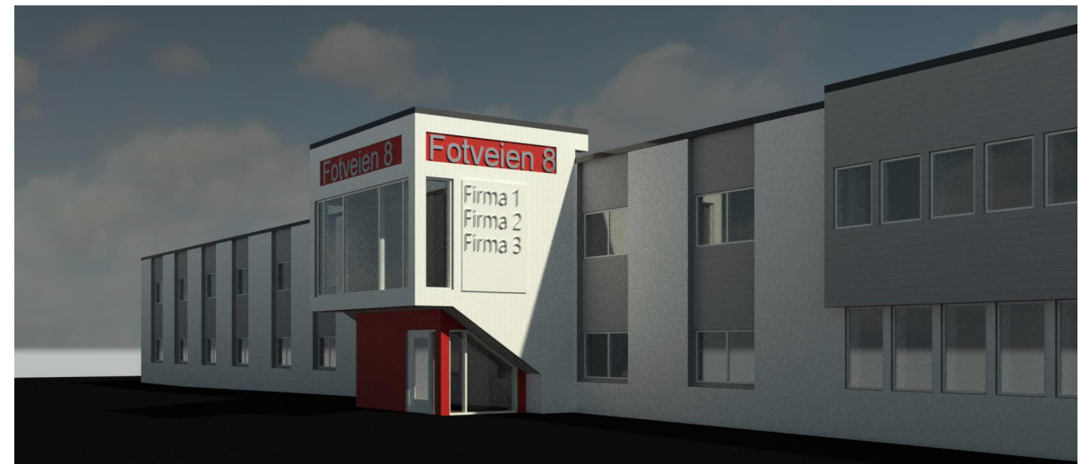
Rød 1 : 1