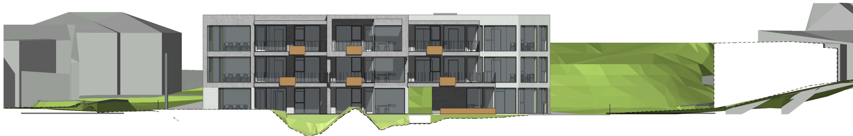
Fasade mot vest