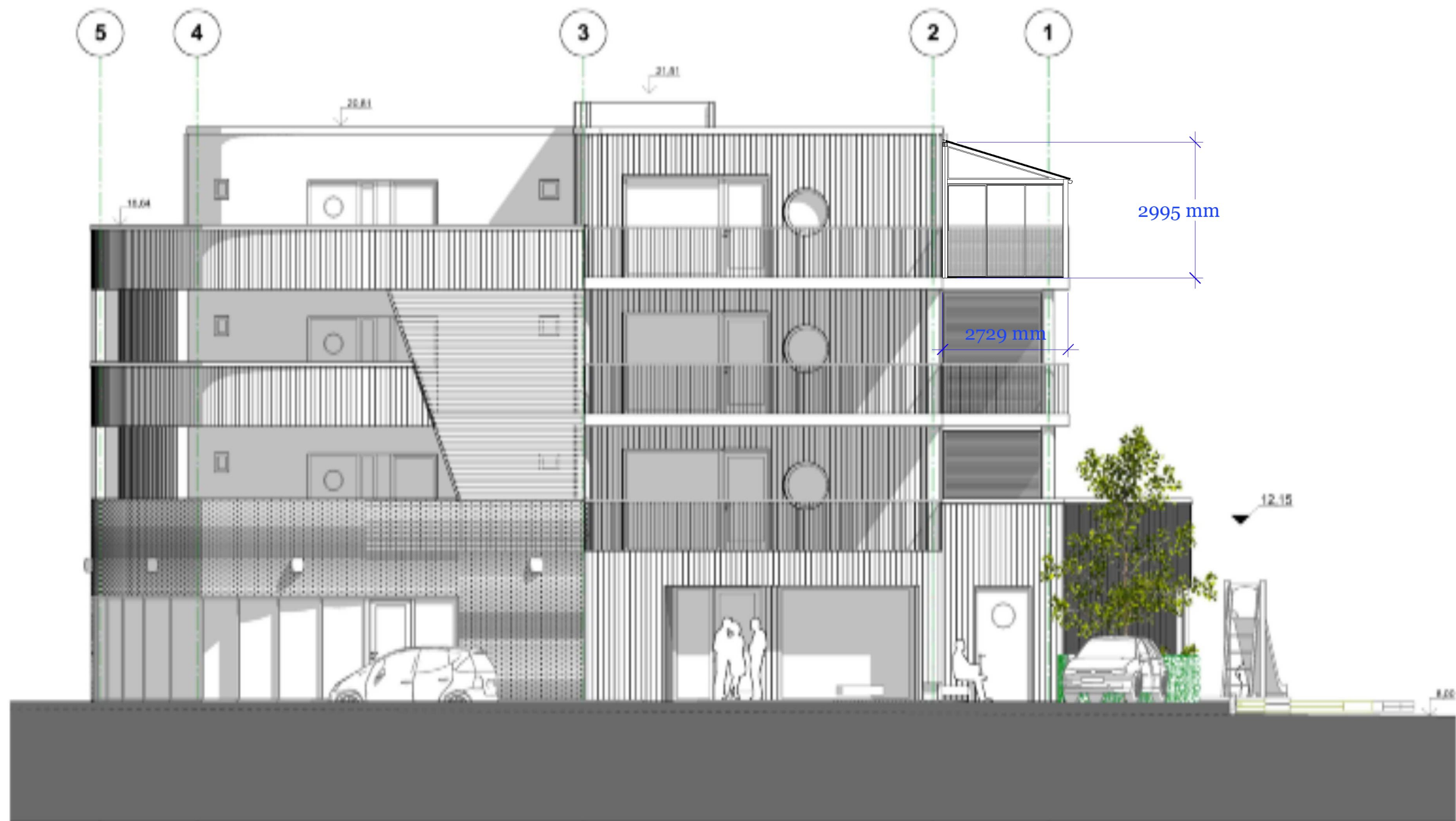
1:100 Fasade Nord