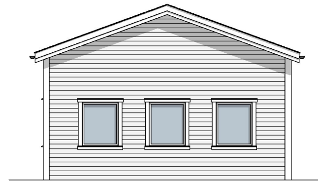
FASADE MOT SØR