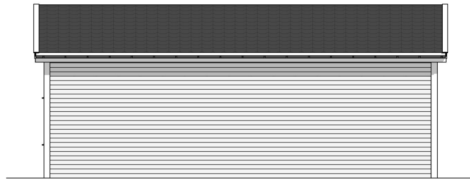
FASADE MOT ØST