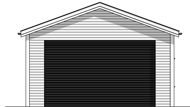
FASADE MOT NORD