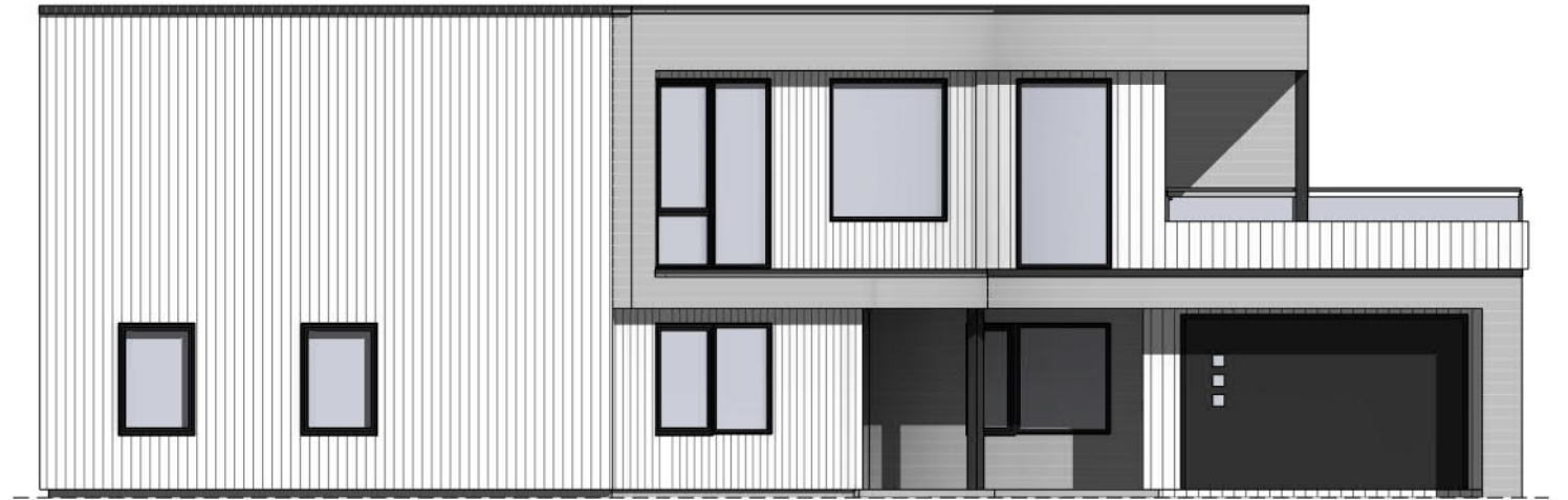
Nord 1 : 100