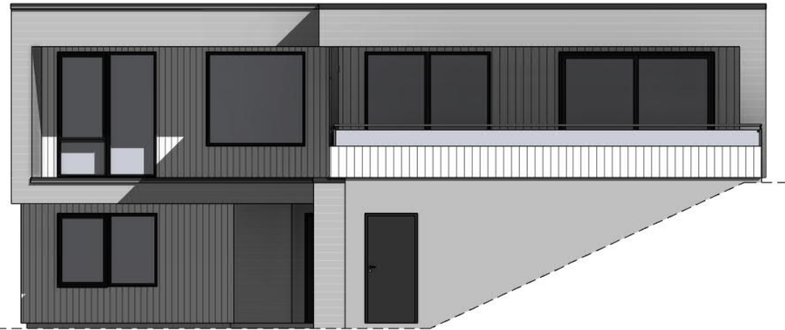
Vest 1 : 100