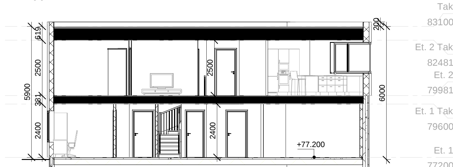
Snitt 2 1 : 100