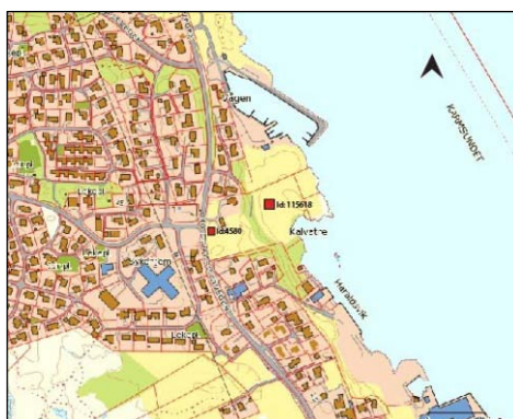
Figur 1: Oversiktskart av næringsområdet. Anleggene er merket med røde firkanter og Id nummer

Undersøkelsesområdet ligger på øst sida av Storasundvegen når man kjører i nord retting gjennom Storasund. Den mulige gravrøysen er synlig fra vegen og ligger på toppen av et sterkt hellende høydedrag. Kokegropen ligger lenger øst fra vegen (ikke synlig) på en flat terrasse som heller svakt ned til en liten våg, kallet Kalvatre. Mellom de to anleggene er et anna høydedrag og så heller området sterkt ned i mot havet, til det flater ut igjen på terrassen hvor kokegropen ligger.