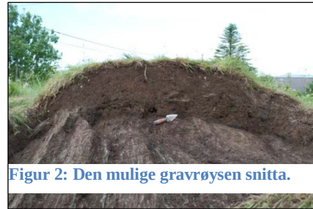
Figur 2: Den mulige gravrøysen snitta.