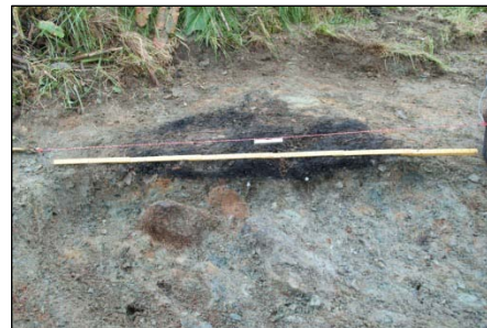
Figur 3: Kokegropen snitta og i ferd med og bli tegnet.

Deltakere kom på undersøkelsessted etter lunsjtid den 07. 06. Undersøkelsen begynte med å snitte den mulige gravrøysen som ligger oppe på et lite høydedrag øst for Storasundvegen, rett sør for innkjørselen til boligen på garden. Først ble den fotografert og tegnet opp i plan og deretter snitta med spade. Det ble snart åpenbart at den mulige gravrøysen var en naturlig formasjon. Profilen ble finrensa og fotografert. Den 08. 06. ble røysen tegnet i profil. En kokegrop som ble påvist i en sjakt i RFK sin undersøkelse i 2008 ble også funnet fram og dokumentert både i plan og profil. To trekullprøver ble samlet inn til ^{14}\text{C} datering fra kokegropen.