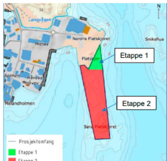
Figur 1. Etappe 1 og 2 illustrert i tiltaksområdet.

COWI avd. Stavanger søker på vegne av tiltakshaver Karmsund Havn IKS om å utvide havneområdet til den eksisterende havnen på Husøy i form av en containerterminal for Karmsund Havn IKS. Det søkes om en betydelig utfylling i sjø (etappe 2, figur 1) og peling av betongkai. Tiltaket i sin helhet forventes å være ferdigstilt innen 2026-2027.