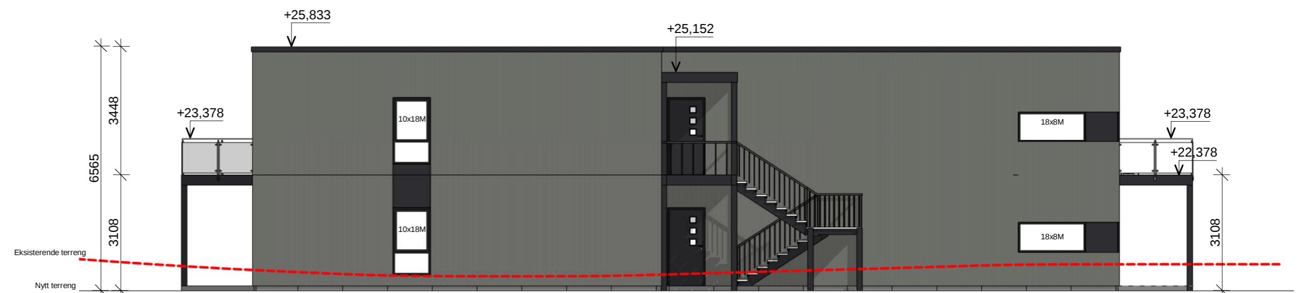
Nord Rammesøknad 1 : 100