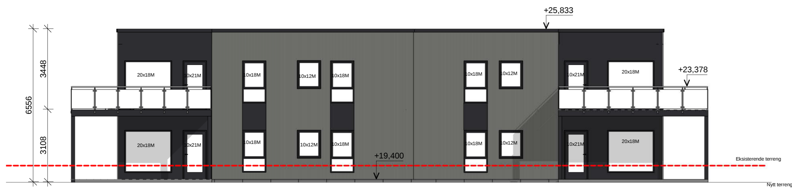
Sør Rammesøknad 1 : 100