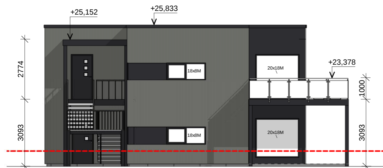
Vest Rammesøknad 1 : 100