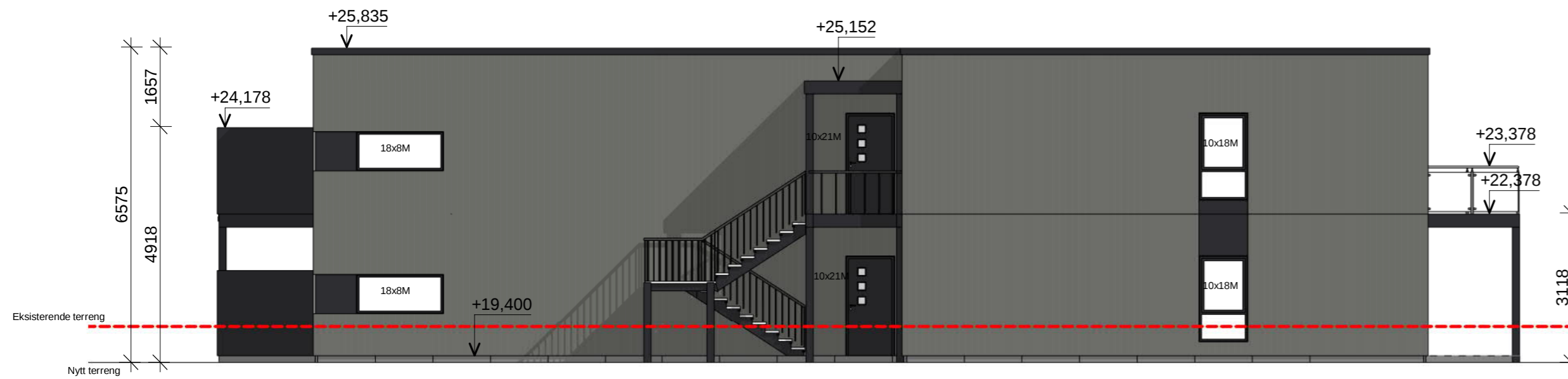
Nord Rammesøknad 1 : 100