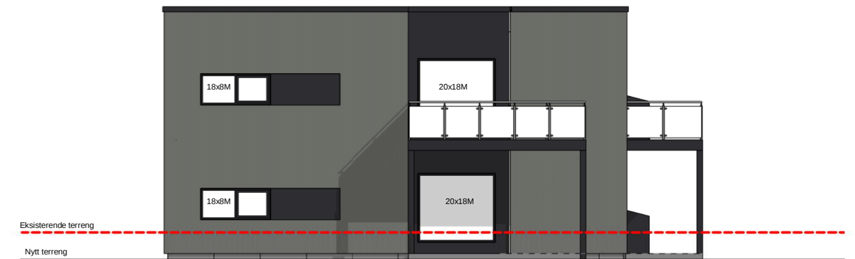
Vest Rammesøknad 1 : 100