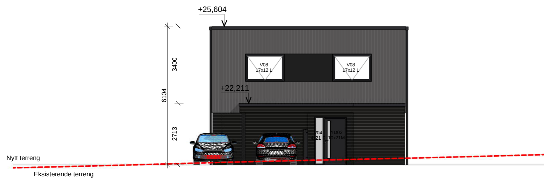
Øst 1-100 1 : 100