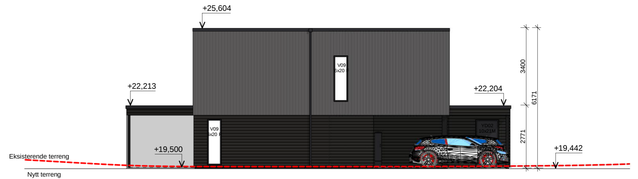
Sør 1-100 1 : 100