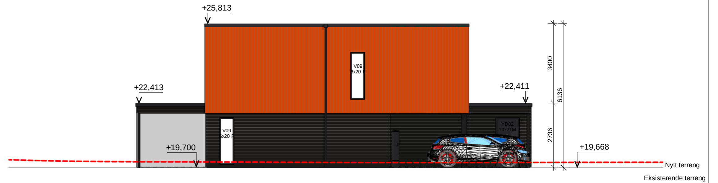
Sør 1-100 1 : 100