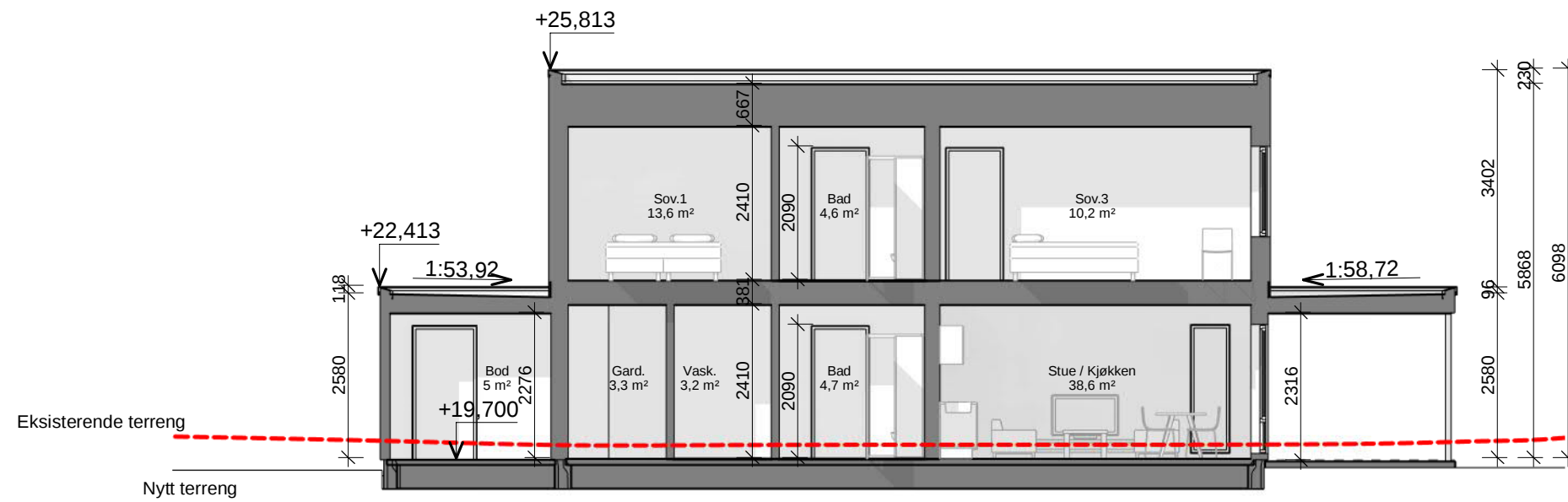
Snitt 1 Anmeldelse 1 : 100