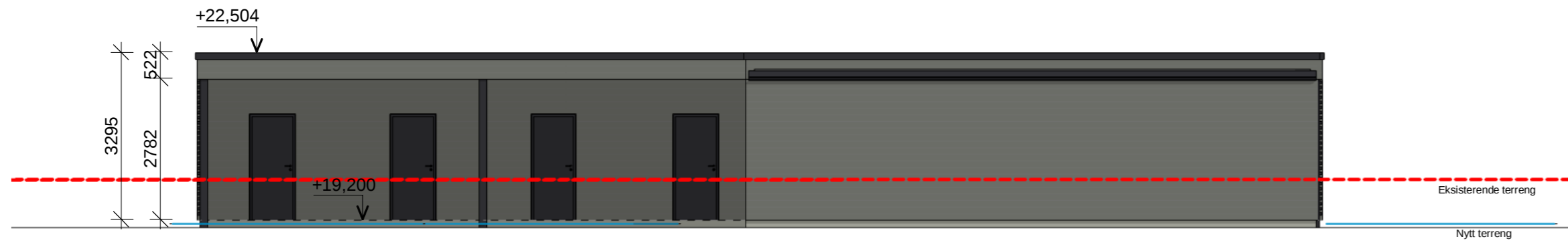
Sør Rammesøknad 1 : 100