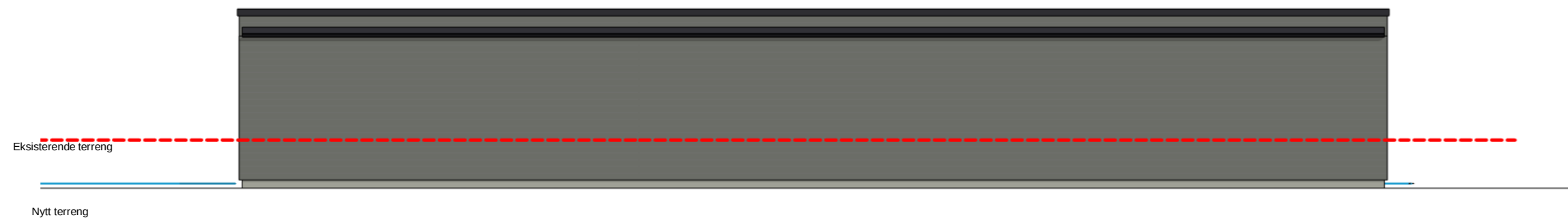
Nord Rammesøknad 1 : 100