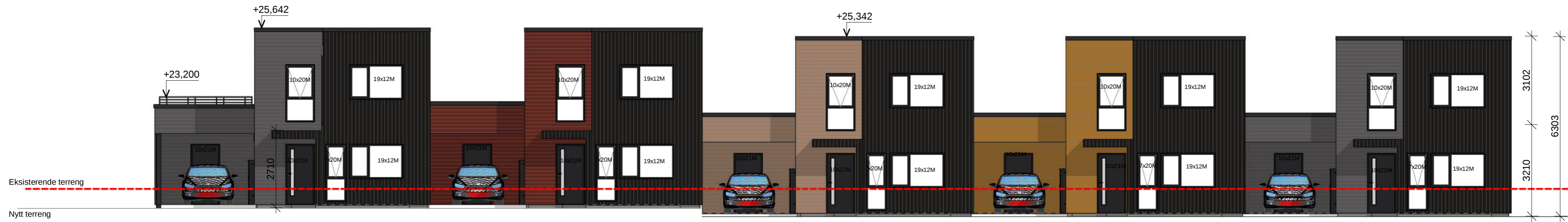
Sør Rammesøknad 1 : 100