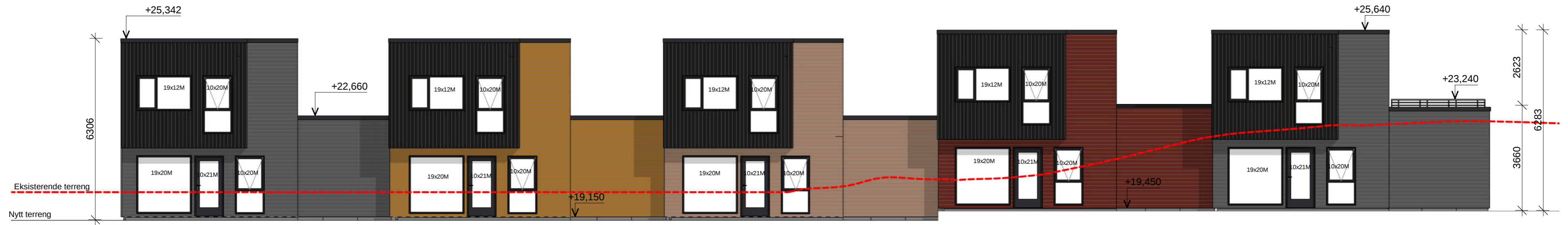
Nord Rammesøknad 1 : 100