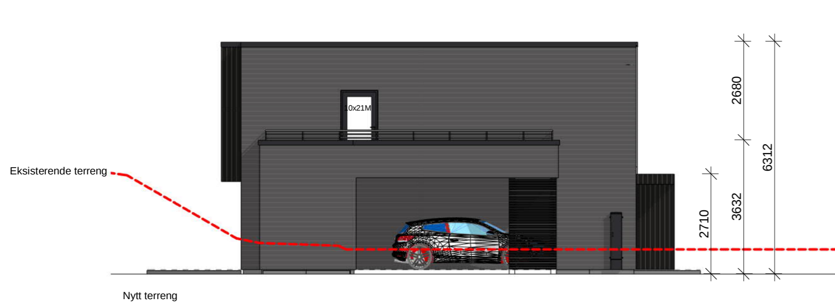
Vest Rammesøknad 1 : 100