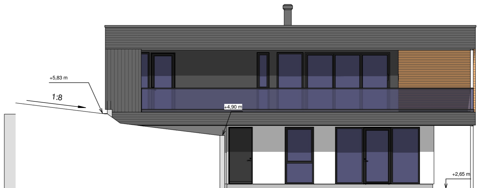
Fasade mot vest 1 : 100