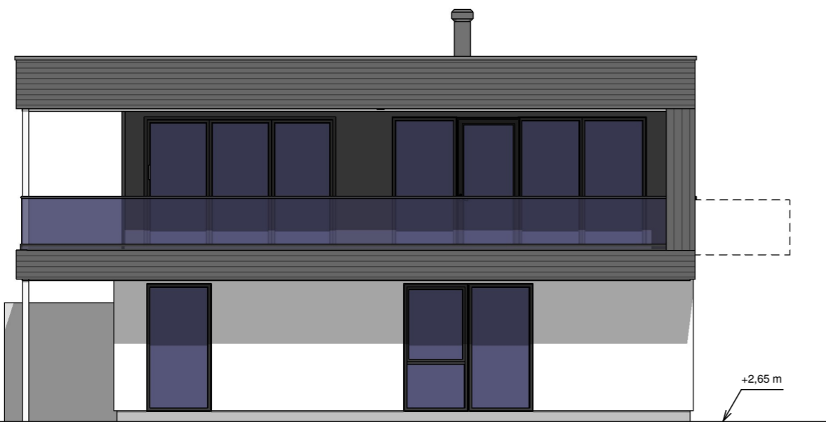
Fasade mot sør 1 : 100