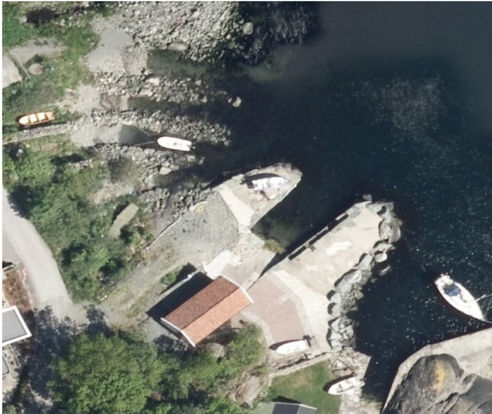
Luftfoto 2013- under luftfoto 2021

I strandsonen skal det etter pbl. § 1-8 første ledd tas særlig hensyn til natur- og kulturmiljø, friluftsliv, landskap og andre allmenne interesser. Disse hensynene skal ikke bli skadelidende om dispensasjon gis. Strandsonen er definert som område av nasjonal verdi. Karmøy kommune er blant de kystkommuner i Rogaland med stort press på arealene. Området er regulert til felles båtopptrekk og naust og arealet boden er plassert på var opparbeidet før bygging- jf luftfoto under. Tiltaket endrer ikke arealene mht privatisering eller ferdsel langs strandsonen utover eksisterende forhold. Hensynene bak bestemmelsen anses ikke vesentlig tilsidesatt.