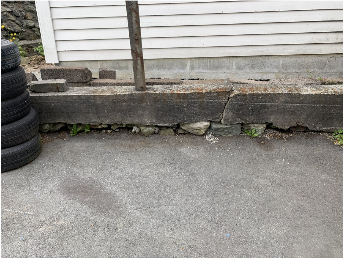
Bilde tatt fra vest mot øst (dette bilde ble liggende og jeg klarer ikke rette det opp. Vri litt på hode :P)