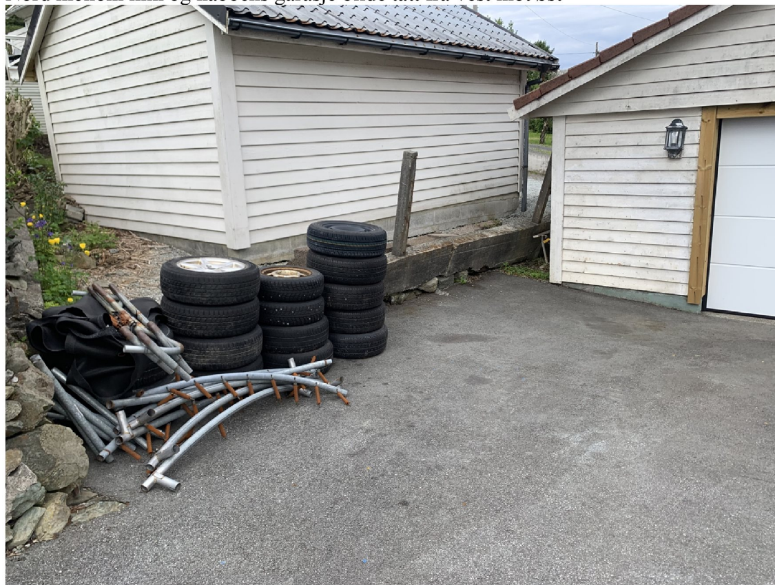
Bilde tatt rett nord