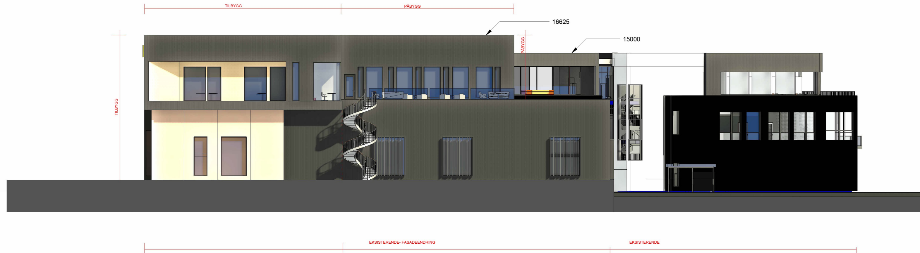
Fasade nord vest 1 : 200