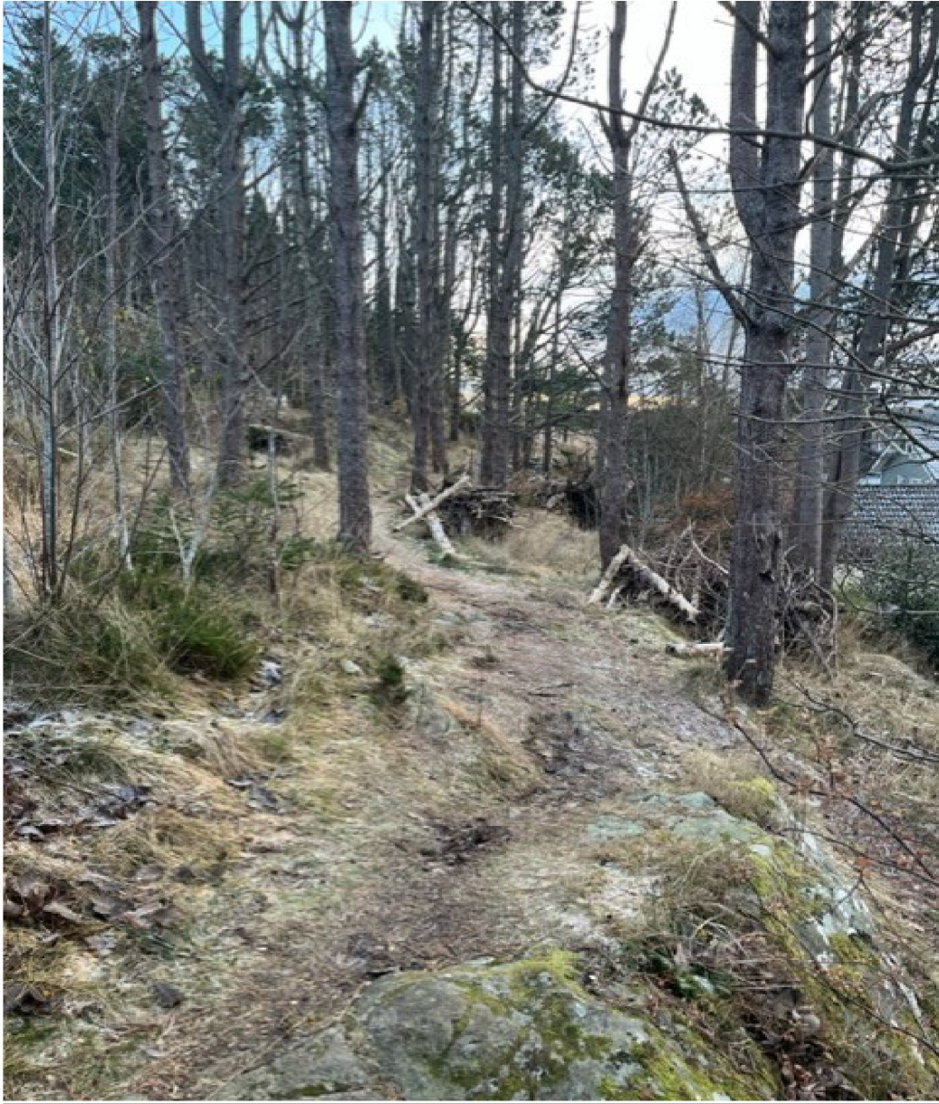
Del av eksisterende sti som skal utvides