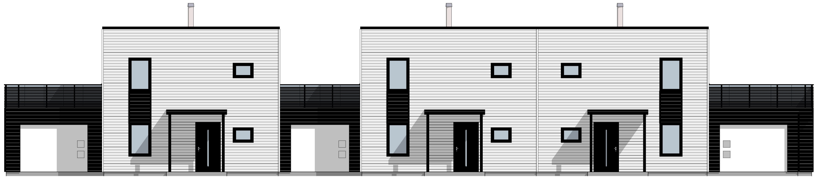
1:100 Fasade Øst