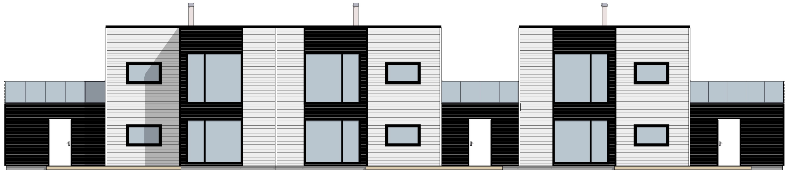
1:100 Fasade Vest