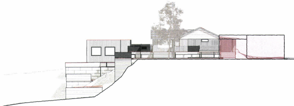
FASADE SØR 1:250

VILLA RALUCA FASADER EKSISTERENDE Hauskeivågvegen 84 4260 Torvestad