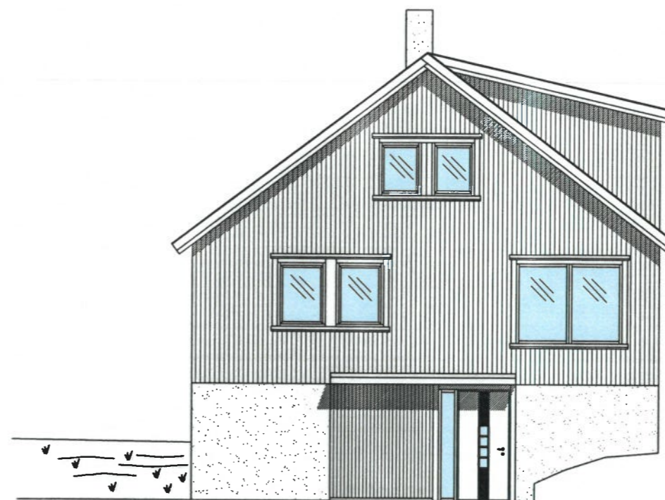
Fasade mot Nord