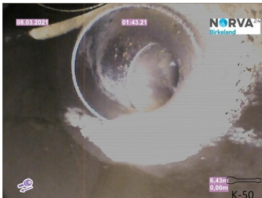
Spillvann_Inn til hus_Septik tank_20210308_131232.jpg

Dato for inspeksjonen 08.03.2021 Inspeksjonsnummer 2 Inspeksjonsretning Motstrøms