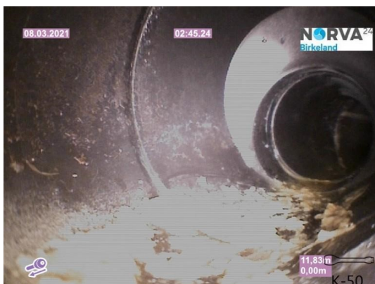
Spillvann_Inn til hus_Septik tank_20210308_131400.jpg