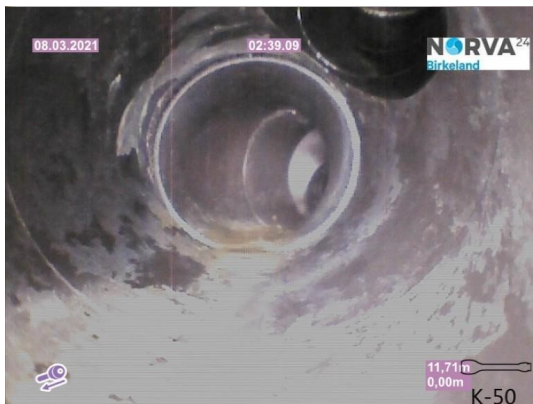
Spillvann_Inn til hus_Septik tank_20210308_131349.jpg