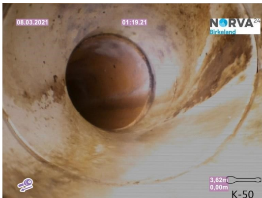
Spillvann_Inn til hus_Septik tank_20210308_131155.jpg