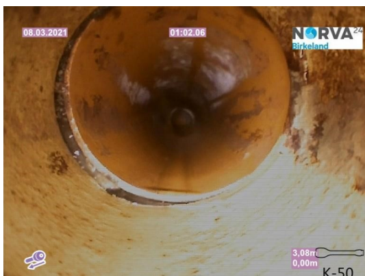
Spillvann_Inn til hus_Septik tank_20210308_131124.jpg