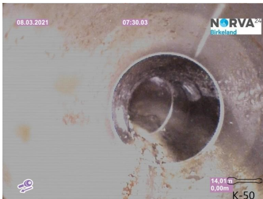
Spillvann_Inn til hus_Septik tank_20210308_132820.jpg