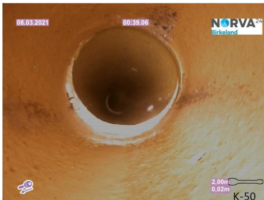
Spillvann_Inn til hus_Septik tank_20210308_131054.jpg