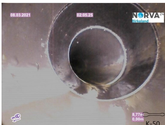
Spillvann_Inn til hus_Septik tank_20210308_131258.jpg