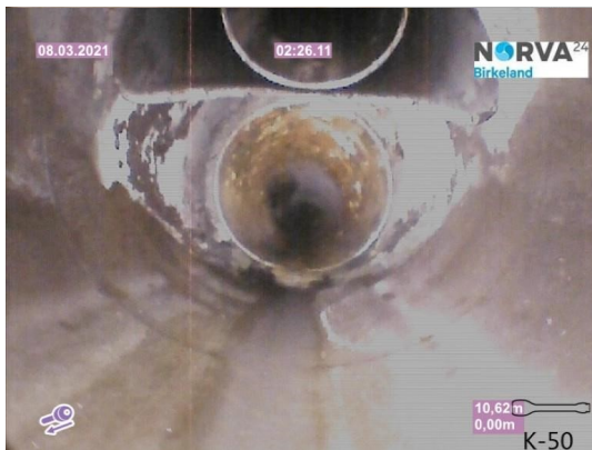
Spillvann_Inn til hus_Septik tank_20210308_131331.jpg

Dato for inspeksjonen 08.03.2021 Inspeksjonsnummer 2 Inspeksjonsretning Motstrøms