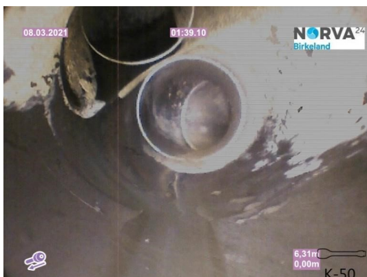
Spillvann_Inn til hus_Septik tank_20210308_131220.jpg