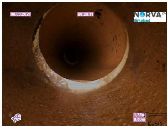
Spillvann_Inn til hus_Septik tank_20210308_131036.jpg