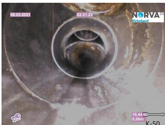
Spillvann_Inn til hus_Septik tank_20210308_131319.jpg