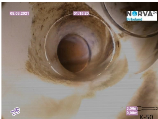
Spillvann_Inn til hus_Septik tank_20210308_131146.jpg

Dato for inspeksjonen 08.03.2021 Inspeksjonsnummer 2 Inspeksjonsretning Motstrøms